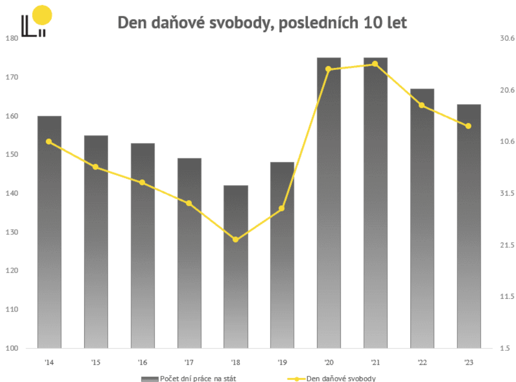
Graf: DEN DAŇOVÉ SVOBODY V ČESKÉ REPUBLICE (2014–2023)

V mezinárodním kontextu zemí OECD je Česká republika téměř přesně v polovině pole. Česká republika má dlouhodobě Den daňové svobody před průměrem eurozóny (5. 7.), což je výsledek, jenž má relevanci i ve světle neutuchajících úvah o přijímání společné evropské měny. Medián OECD je sice tři dny po našem Dni daňové svobody, avšak průměr je po pandemii o týden napřed (6. 6.). Jak ukazuje graf na následující straně, jako první oslavili Den daňové svobody Irsku (19. 3.), poté ve Švýcarsku (9. 5.) a poté v Izraeli (17. 5.).